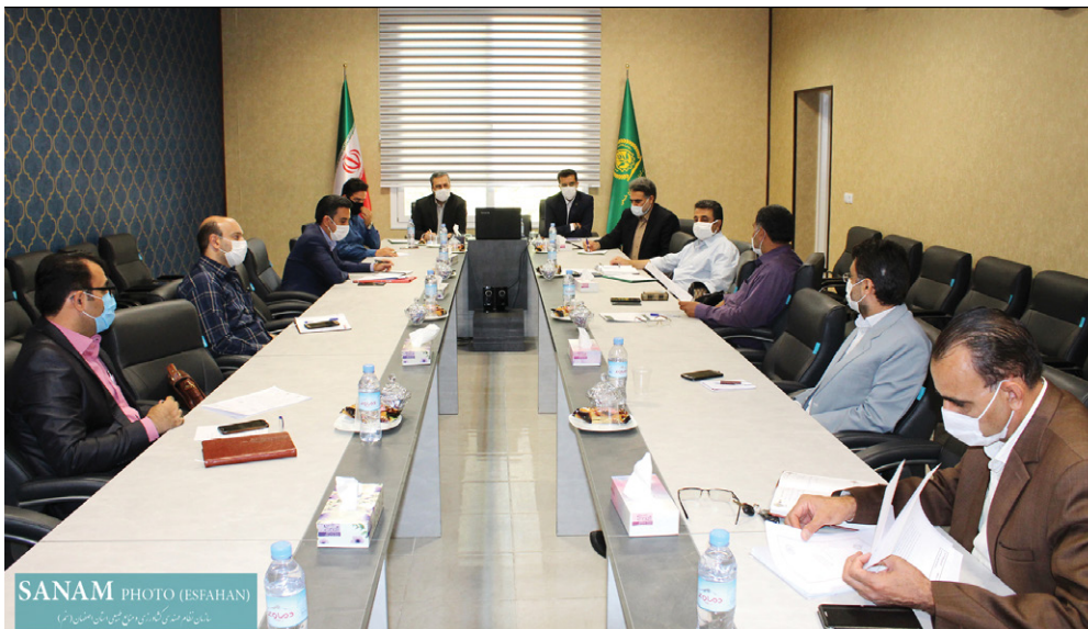
SANAM PHOTO (ESFAHAN)

گفتنی است در این جلسه تصمیماتی در خصوص نحوه عملکرد مراکز خدمات کشاورزی غیردولتی استان به ویژه برون‌سپاری وظایف تصدی‌گری و حمایت از این مراکز اتخاذ شد.