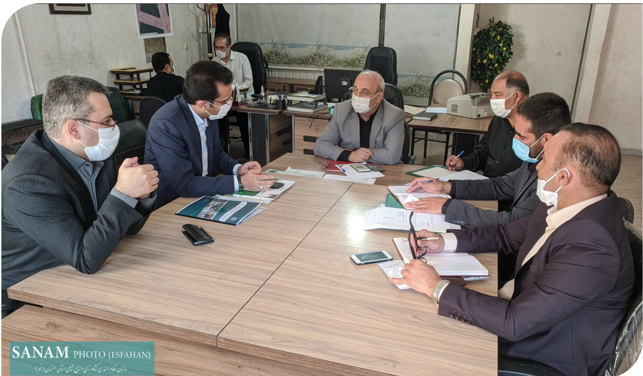
مانع نامه مهندسی کشاورزی و منابع طبیعی استان اصفهان

در این جلسه درخواست هایی از جمله ایجاد ساز و کار معافیت های بیمه و مالیاتی برای کارشناسان کشاورزی، جلوگیری از پذیرش بی رویه دانشجویان رشته های کشاورزی، اجرای تبصره ۱ ماده ۱۶ قانون هوای پاک، تامین نهاده های دامی مورد نیاز استان، حمایت برای ایجاد شهرک های تخصصی کشاورزی به ویژه در حوزه صنایع تبدیلی و تکمیلی بخش کشاورزی و نظارت بر پاسخ گویی دستگاه های اجرایی به استعلام های مرتبط با صدور مجوزهای بخش کشاورزی؛ توسط معاون برنامه ریزی و توسعه کارآفرینی، نایب رییس و دبیر شورای سازمان مطرح شد.