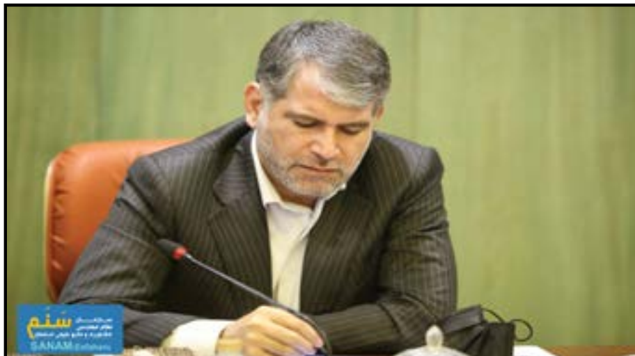
متن پیام به روسای سازمان جهاد کشاورزی استان‌ها به شرح زیر است؛

به گزارش پایگاه اطلاع‌رسانی سنم به نقل از پاج، سیدجواد ساداتی نژاد در نامه‌ای به رؤسای سازمان جهاد کشاورزی استان‌ها، از کشاورزان و همکاران بخش کشاورزی درخواست کرد با انگیزه و اراده مضاعف، ضمن تقویت روحیه همکاری و تعاون، در راستای تحقق اهداف تعیین شده نهایت کوشش و جدیت را به کار بسته و موجبات رضایت خداوند متعال و مردم شریف ایران را فراهم کنند.