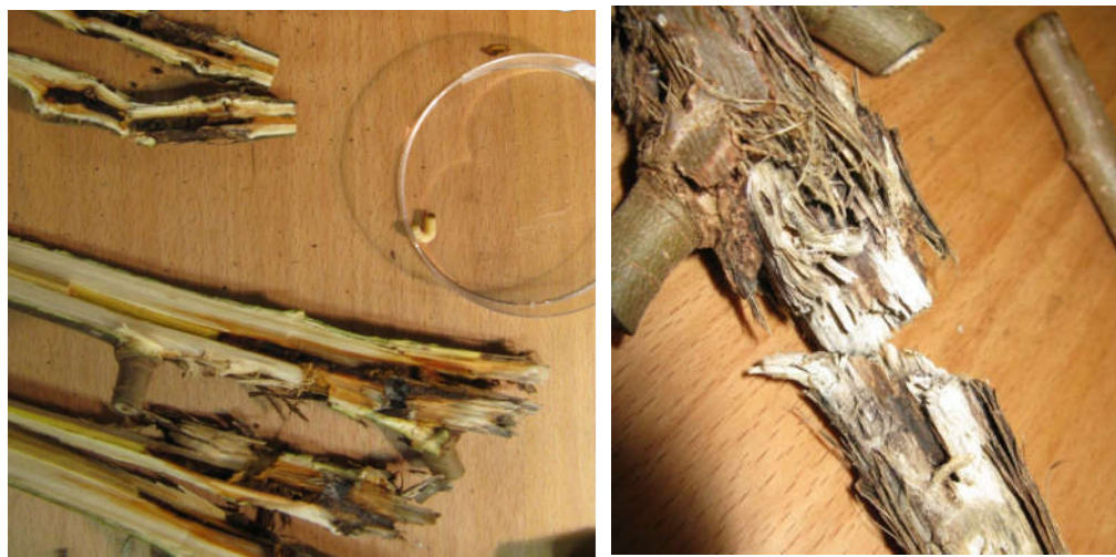
شکل ۷- خسارت چوبخواری لارو آفت (راست)، دالان لاروی و لارو آفت (چپ)