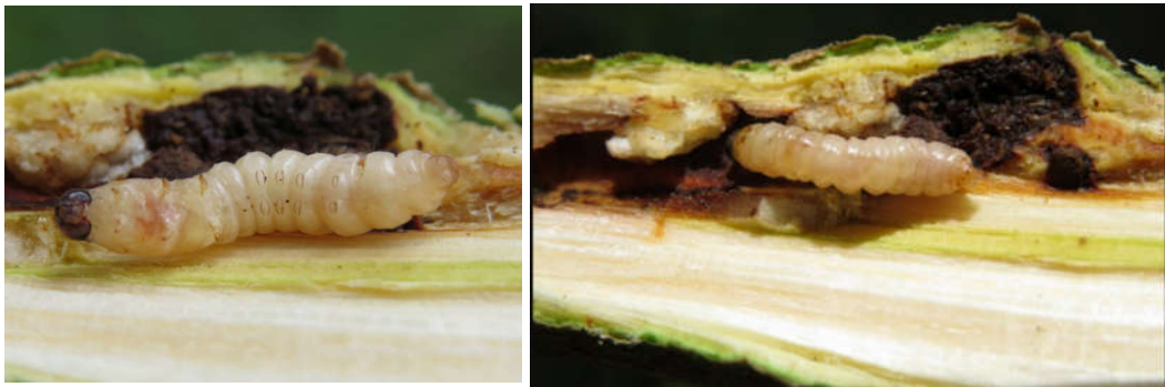
شکل ۲- لارو آفت