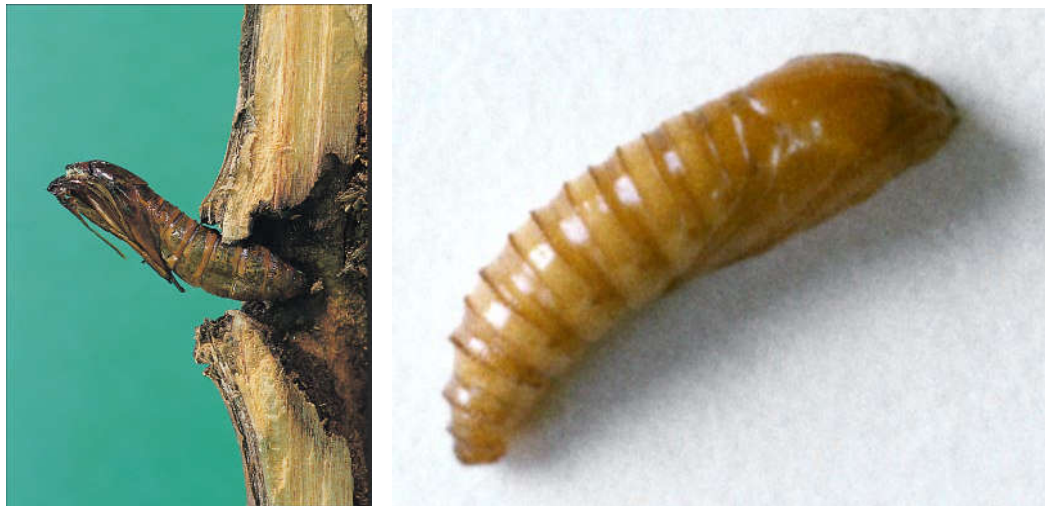
شکل ۳- شفیره P. tabaniformis در ابتدای رشد آن (چپ)