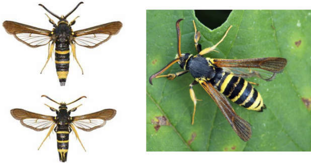
شکل ۱- حشره بالغ P. tabaniformis (راست) و حشره بالغ نر (چپ بالا) و حشره بالغ ماده (چپ پایین)