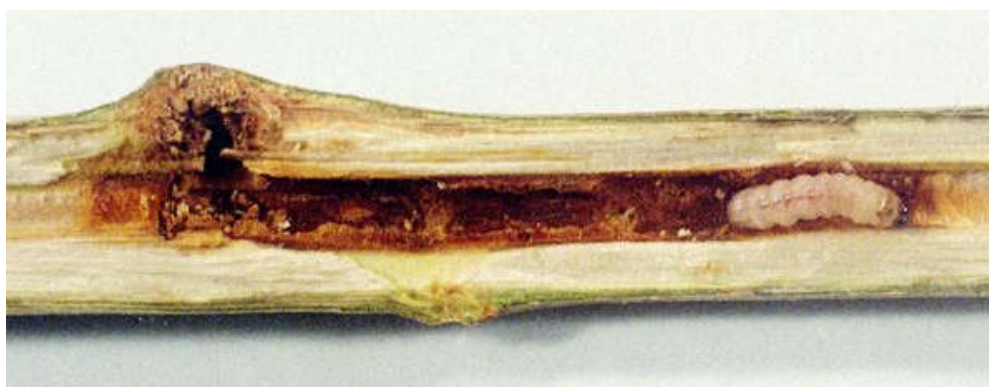
شکل ۴- لارو آفت در ساقه یک ساله صنوبر

علائم رایج زیر نشان می‌دهد که گیاهان میزبان آلوده به P. tabaniformis هستند: تورم (گال) روی ساقه‌ها و شاخه‌ها، سوراخ‌های ورودی لارو با پارگی بافت بیرون زده، سوراخ‌های خروجی حشرات بالغ با پوست شفیرگی و شکستگی ساقه. لاروها ابتدا از پوست داخلی تغذیه می‌کنند و بعداً به داخل ساقه‌های صنوبر فرو رفته و دالان‌هایی در چوب ایجاد می‌کنند. در نهالستان، نهال‌های صنوبر یک ساله آلوده، گال‌های متقارن را در نقاط تغذیه لارو تشکیل می‌دهند. این گال‌ها تا پایان دوره رشد گیاه به کندی رشد می‌کنند. گیاهان میزبان آلوده با سوراخ‌های خارجی دالان‌های لاروی همراه فضولات حشره (مواد دفعی و ذرات چوب) مشخص می‌شوند. در مزارع کشت صنوبر، درختان دو و سه ساله آلوده با تورم موضعی در نقاط آلوده قابل تشخیص هستند. در حالی که درختان قدیمی‌تر بدون تورم هستند. پس از ظهور حشرات بالغ، سوراخ‌های خروجی با بخشی از پوست شفیرگی به وضوح قابل مشاهده است. همچنین از سوراخ‌های خروجی دالان‌های لاروی فضولات خارج می‌شود. لاروهای نسل‌های مختلف آفت می‌توانند در طی سال‌های متوالی در یک مکان رشد کنند. در این مورد، منافذ بیرونی بزرگی در نقاط آلوده ایجاد می‌شوند.