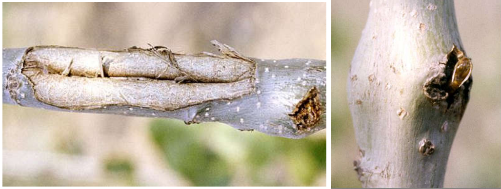
شکل ۶- پوسته شفیرگی آفت که از سوراخ خروجی یک نهال صنوبر یک ساله بیرون زده است (راست) و گال روی ساقه نهال صنوبر یک ساله (چپ)