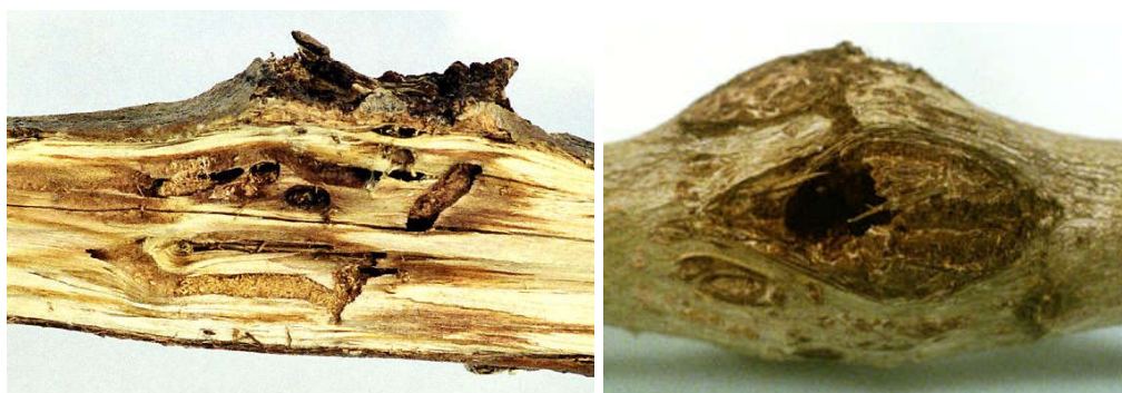
شکل ۵- سوراخ بیرونی دالان‌های لارو روی ساقه صنوبر سه ساله (راست) و دالان لاروی آفت در ساقه صنوبر پنج ساله (چپ)